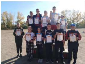
Победители кросса «Золотая осень»

21 октября проходили районные соревнования среди сельских школ по стритболу между командами юношей и девушек.